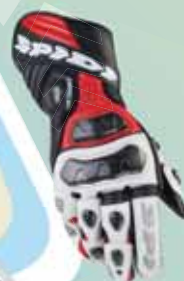
SPIDI «Carbosix» Handschuhe