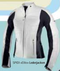
SPIDI «Elite» Lederjacken

BELSTAFF. SAMMY MILLER und CHE GUEVARA trugen sicher mit dazu bei, dass die Lederjacken des britischen Herstellers zum Kult avancierten. Nebst einer Neuauflage der bekannten und bewährten Waxcottonjacken gibt es auch speziell für Motorradfahrer entwickelte Lederjacken . Diese heben sich aber nicht nur durch die Funktionalität von anderen Motorradjacken ab, sondern auch durch den einzigartigen modischen Stil. www.belstaff.com