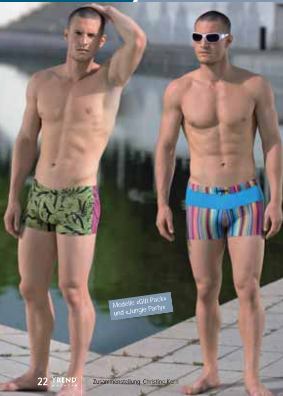
BELDONA / BRUNO BANANI

Die neue BELDONA-Bademode verbindet trendige Farben und Muster mit angesagten Designs.