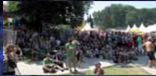
Bellebt bei Hitze: Spritzpistolen.