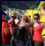
Nachdem die Schweiz aus- geschieden war, traten andere Flaggen hervor.