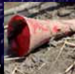
Vuvuzelas waren unerwünscht.