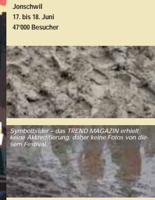
Symbolbilder – das TREND MAGAZIN erhielt keine Akkreditierung, daher keine Fotos von diesem Festival.