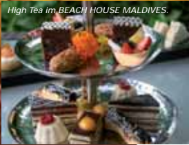
High Tea im BEACH HOUSE MALDIVES.