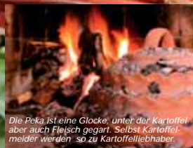
Die Peka ist eine Glocke, unter der Kartoffel aber auch Fleisch gegart. Selbst Kartoffelmeider werden so zu Kartoffellebhaber.