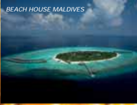
BEACH HOUSE MALDIVES