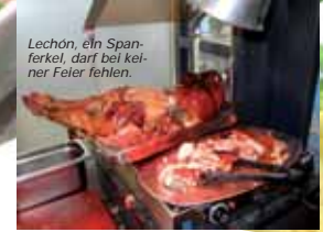
Lechón, ein Spanferkel, darf bei keiner Feler fehlen.