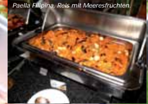
Paella Filipina, Reis mit Meeresfrüchten.