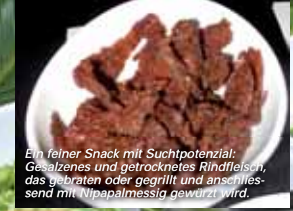
Ein feiner Snack mit Suchtpotenzial: Gezalzenes und getrocknetes Rindfleisch, das gebraten oder gegrillt und anschliessend mit Nipapalmessig gewürzt wird.