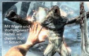
Mit Magie und Waffengewalt halten wir diesen Troll im Schach.