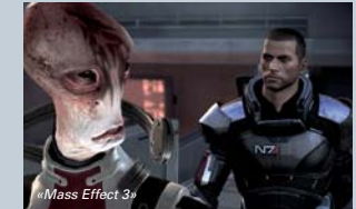
«Mass Effect 3»