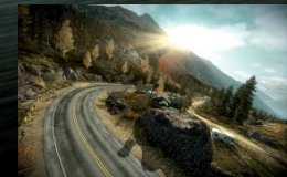
Eine Stärke der «Frostbite 2»-Engine sind schicke Lichteffekte und weitläufige Landschaften.