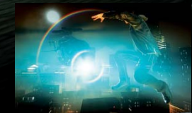
Erstmals in der Geschichte der Serie findet die Action auch ausserhalb des Fahrzeugs statt.