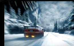
Das Rennen im Lawinengebiet ist nur eines der Highlights in «Need for Speed: The Run».