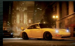
Die abwechslungsreichen Kurse führen auch mal direkt durch die Innenstadt.