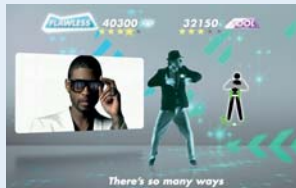
There's so many ways

«Dancestar Party»; Tanzspiel; PS3; (Sony)