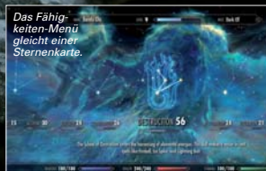
Das Fähigkeiten-Menü gleicht einer Sternenkarte.